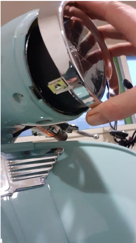
Enlever le cerclage de phare