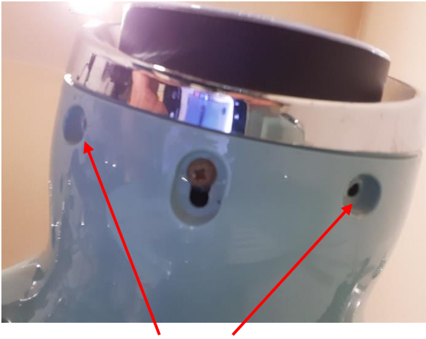
Enlever les deux vis sous le phare