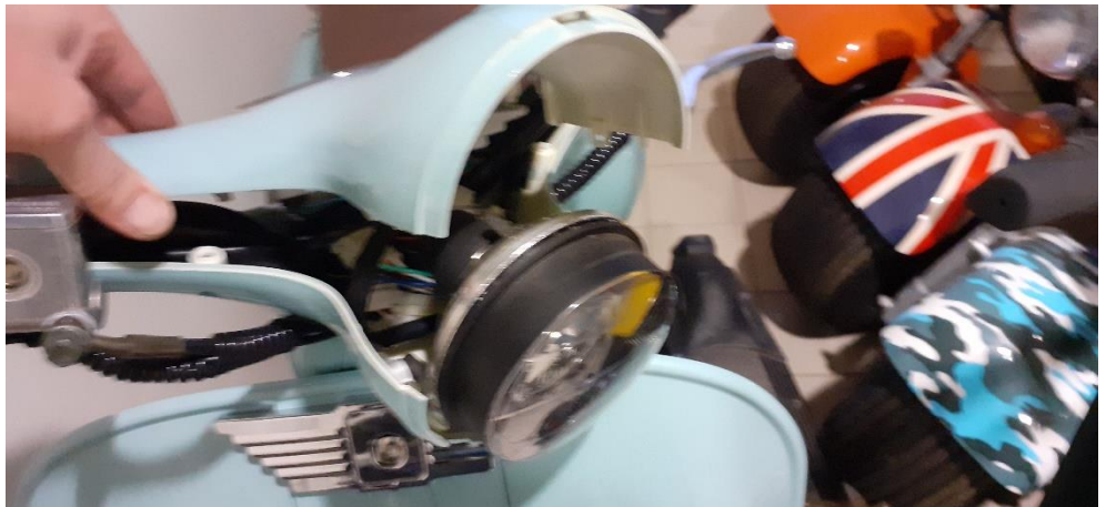
Déboîter la partie supérieur